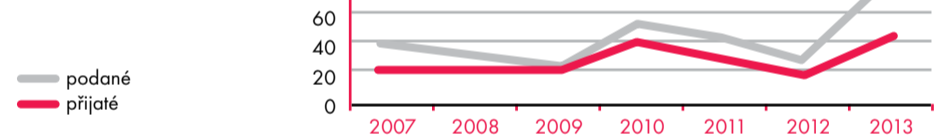
Vývoj počtu zlepšovacích návrhů 2007-2013