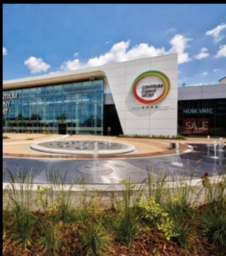
Fontány, Centrum Černý Most