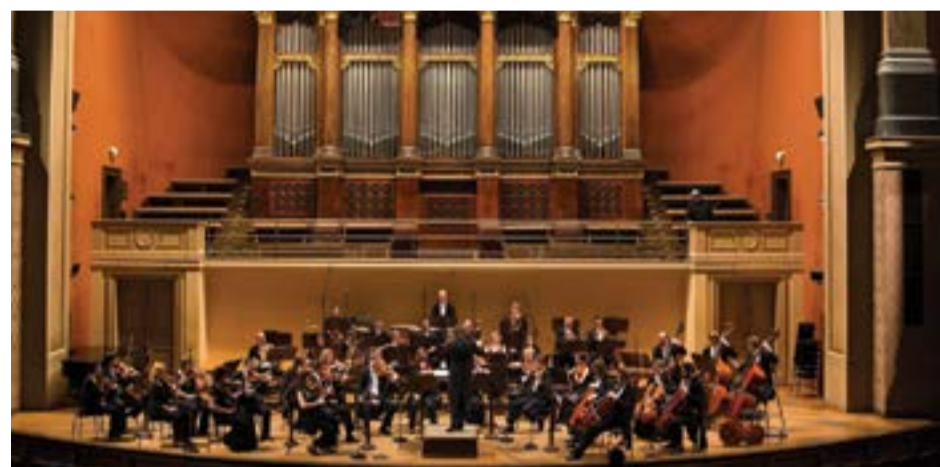
PKF – Prague Philharmonia

Společnost KASPER je již více než 20 let nejvěrnějším sponzorem festivalu komorní hudby Trutnovský podzim. Letos se nám podařilo společně s vedením Společenského centra Trutnovska UFFO realizovat velmi kvalitní zahajovací koncert, na který jsme pozvali PKF – PRAGUE PHILHARMONIA. Koncert se uskutečnil 4. 10. 2013 v 19 hodin ve Společenském centru Trutnovska UFFO. Jednalo se o pro Trutnov výjimečnou kulturní událost, kterou měli možnost si poslechnout i naši zaměstnanci a pozvaní hosté.