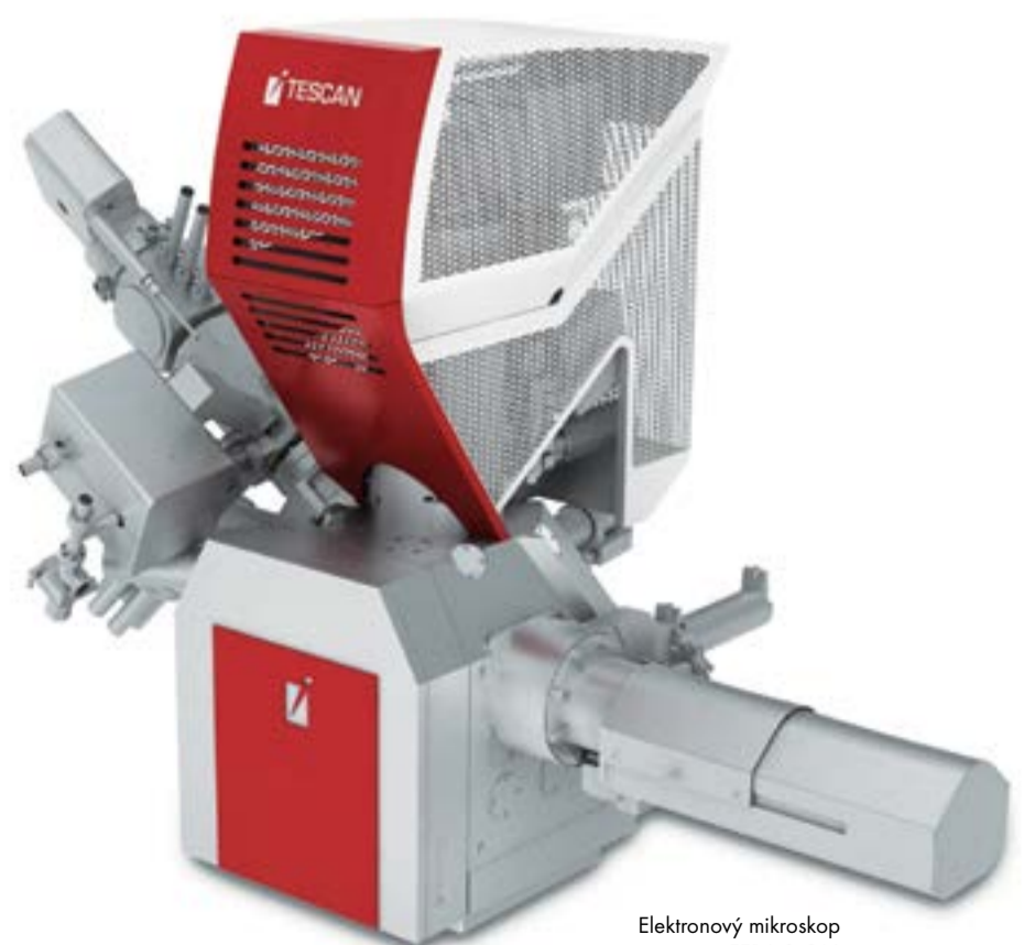
Elektronový mikroskop FERA 3 GM