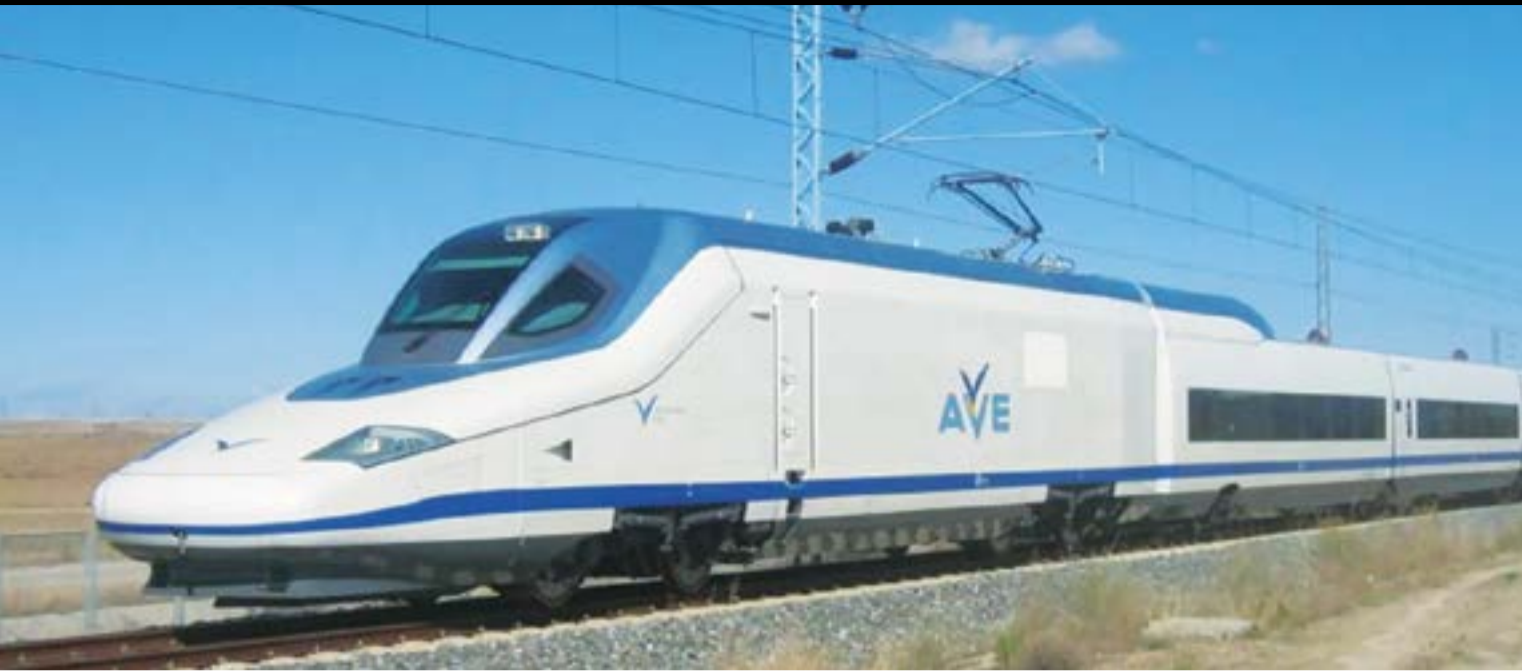
Vysokorychlostní vlak TALGO Avrial (max. rychlost 380 km/h)