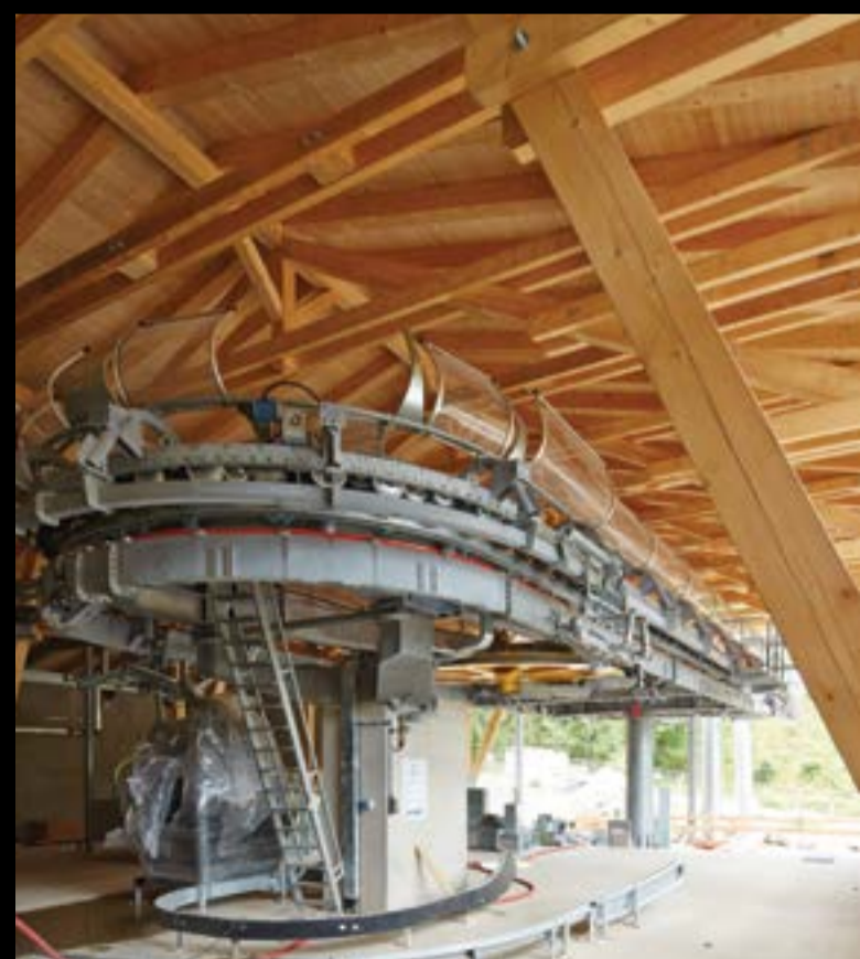
Lanová dráha na Sněžku